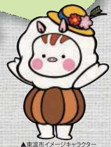
▲東温市イメージキャラクター「いのとん」